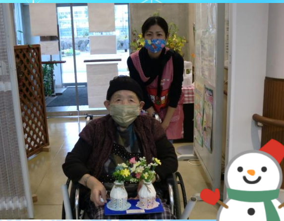
山江村の保育園から 勤労感謝の日の プレゼントを頂きました。