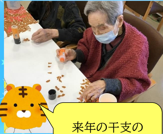
来年の干支の ちぎり絵作成中